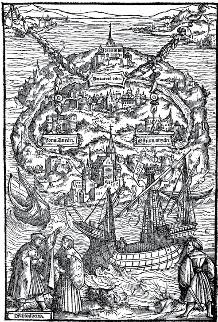
Ambrosius Holbein, Utopija , drvorez, iz: Thomas More, Libellus vere aureus, nec minus salutaris quam festivus, de optimo rei publicae statu deque nova insula Utopia , Johann Froben, Basel, 1518.