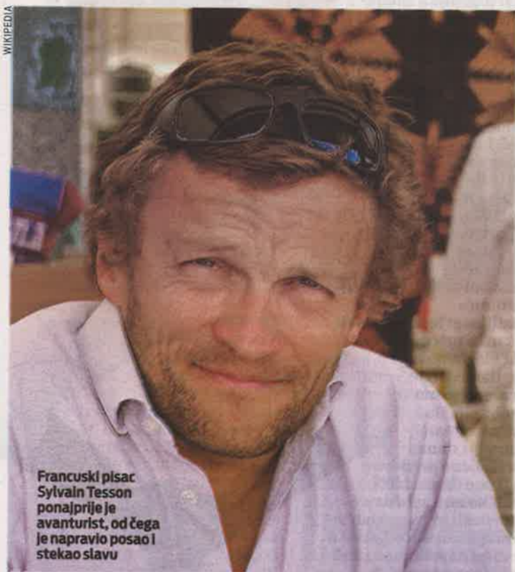
Francuski pisac Sylvain Tesson ponajprije je avanturist, od čega je napravio posao i stekao slavu

Djelo, za koje je autor dobio Prix Renaudot 2019., nije roman u klasičnom smislu te bi se mogao uvrstiti u novi podžanr: ekološki aktivizam