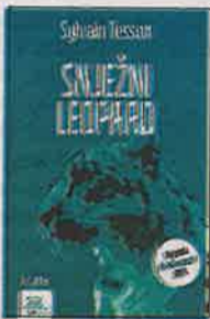
SYLVAIN TESSON "Snježni leopard" TIM press prev. Dubravka Celebrini Zagreb, 2021.

Djelo, za koje je autor dobio Prix Renaudot 2019., nije roman u klasičnom smislu te bi se mogao uvrstiti u novi podžanr: ekološki aktivizam