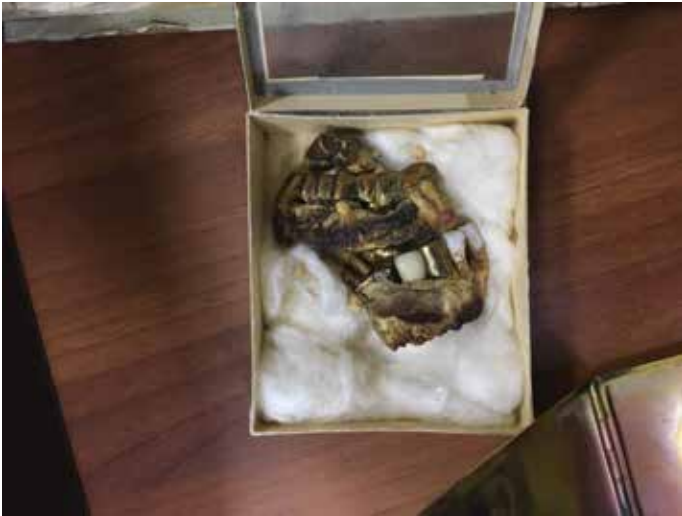
Fotografija 3: Dijelovi Hitlerova zubala. Sovjetski su ih istražitelji navodno iščupali s trupa otkrivenog 4. svibnja u parku oko nove Kancelarije Reicha u Berlinu. I danas se čuvaju u arhivima ruskih tajnih službi, CA FSB.