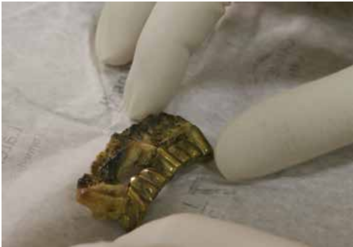
Fotografija 4: Detalj jednog dijela Hitlerova zubala. Tragovi karbonizacije na njegovim ostacima dokazuju da je spaljivanje bilo snažno, no nedovoljno dugo da ošteti zube i proteze.