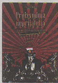
Pierre Conesa "Proizvodnja neprijatelja", TIM press, 2012.

napisao je Nietzsche u djelu "O ljudskim i suviše ljudskim stvarima", koje proročki najavljuje i kasnije ratove. Vrijedi i uz američki vojni budžet od 708 milijardi dolara, tri puta više od Kine, Rusije, Kube, Sjeverne Koreje i Irana - zajedno. Navode se i teorije zavjere, podvale obavještajnih službi, pa i kroz društvene mreže. Tu su i hollywoodski obrasci dežurnog neprijatelja. U ratnim filmovima njemački špijun, kasnije sovjetski, ima hladnoću stroja. U vesternima je