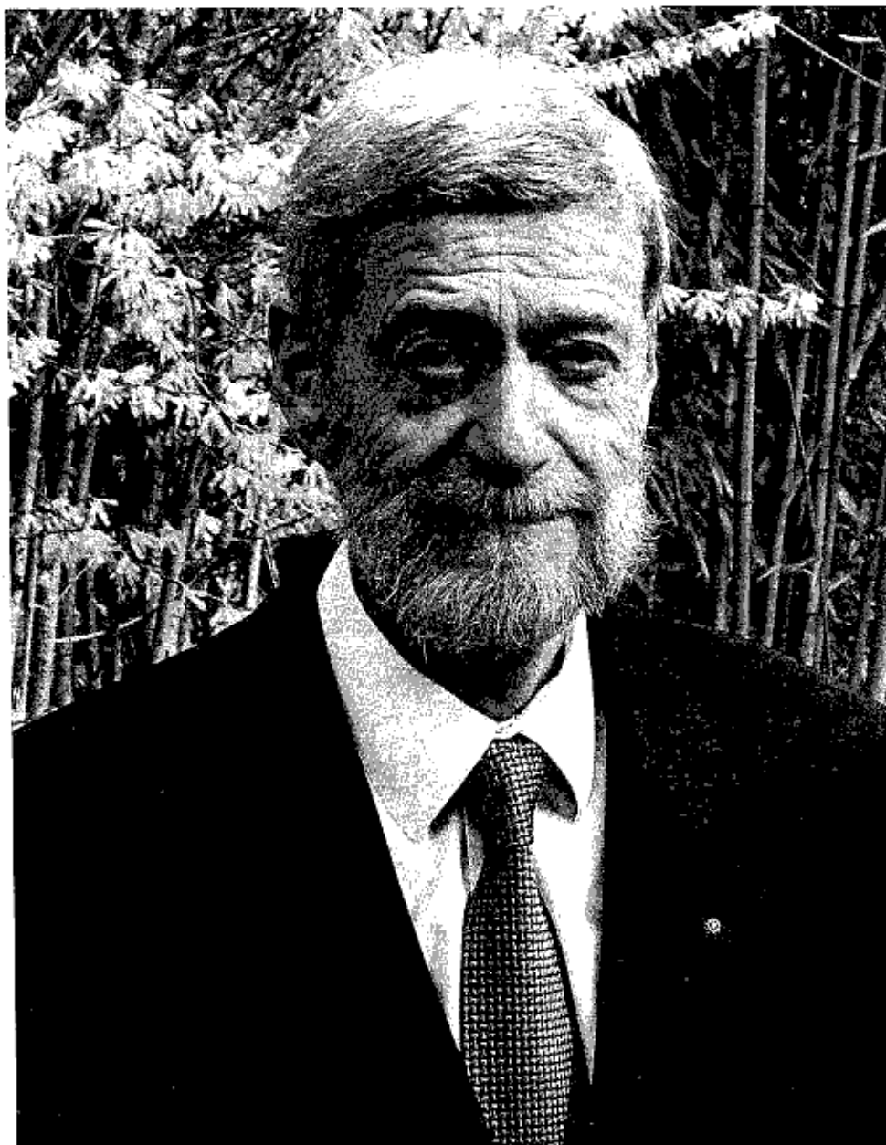
Vampir ispunjava neku potrebu, i nikada se ne javlja posve slučajno, kao puko praznovjerie – Claude Lecouteux

Novovjekovni mit o vampirima krenuo je u kasnom 16. vijeku, i donekle, samo donekle »iscurio« krajem 18. Ovo se prilično podudara s progibanjem vještica i vještaca u Europi. S tim, što se mrtve nije dalo mučiti, a to nije bilo ni potrebno, budući da je bilo dovoljno raz-