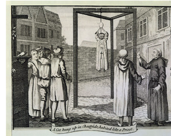
PROTESTANTI VJEŠAJU MAČKU 1554. naziv je grafike iz fonda biblioteke Mary Evans Picture Library, a i u ovom je slučaju mačka odjevena u ljudsku odjeću

Godine 1266. u Fontenay-aux-Rosesu blizu Pariza svinja, osuđena da je pojele dijete, javno je spaljena po nalogu redovnika opatije Sainte-Geneviève. Godine 1386. sud u Falaiseu osudio je krmaču na sakačenje i unakaženje glave i prednjih nogu, a da se onda objesi jer je djetetu razderala lice i ruke i tako prouzročila njegovu smrt. Ovdje je na stvari stroga primjena lex talionis 102 , primitivnog načela odmazde kad se uzima oko za oko i zub za zub. Da bi travestija pravde bila potpuna, krmača je odjevena u čovjekovu odjeću i smaknuta na javnom trgu blizu gradske vijećnice na trošak države u iznosu od deset sua i deset denara, uz to što je krvnik dobio par rukavica. Krvnik je nove rukavice dobio kako bi iz izvršenja dužnosti, barem metaforički, izišao čistih ruku i na taj način pokazao da na sebe kao službenik pravde nije navukao nikakvu krivnju zbog prolijevanja krvi. On nije bio običan svinjoubojica, nego javni dužnosnik, „meštar od visokih djela“, kako su ga službeno nazivali.