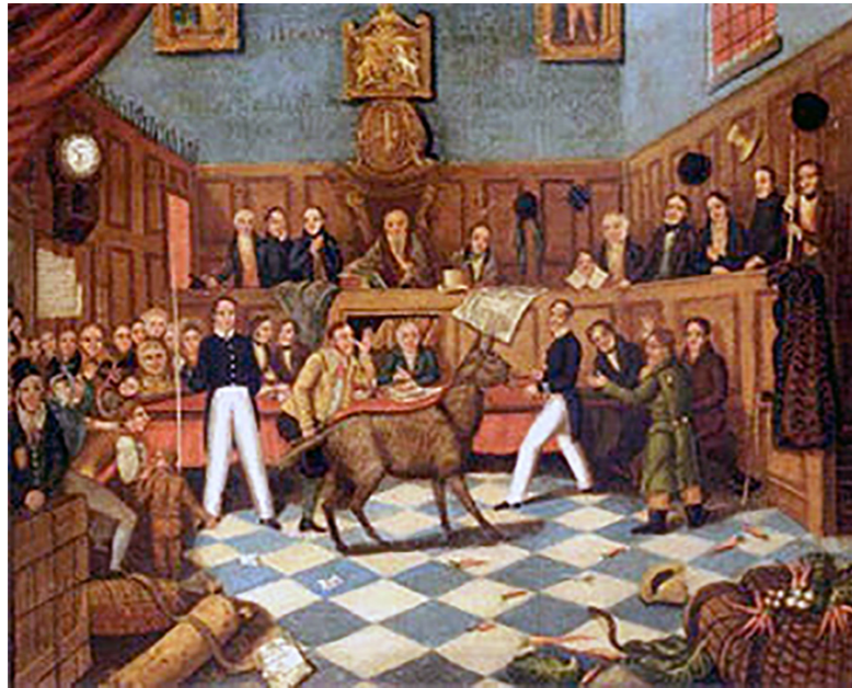
SUĐENJA ŽIVOTINJAMA bila su plod društvenog stanja u kojem je glupim neznanjem vladala brutalna sila

daleko od toga da bi potjecao od profinjenoj i tanahnog osjećaja za pravdu, bio je, kao što će se potpunije pokazati poslije, rezultat izrazito okrutnog, tupog i barbarskog smisla za pravdu. Bio je plod društvenog stanja u kojem je glupim neznanjem vladala brutalna sila i ne treba ga smatrati reakcijom na zakon toljage ni prosvjedom protiv njega jer je zaista naginjao tomu da ga podupire čineći travestiju od vršenja pravde i pretvarajući je tako u ruglo. Bilo je i u interesu crkvenih dužnosnika da se održava ta parodija i izopačenje svete i temeljne ustanove civilnog društva s obzirom na to da je jačalo njihov utjecaj i proširivalo njihove ovlasti jer je podvrgavalo čak i gusjenicu njihovom gospodstvu i kontroli.