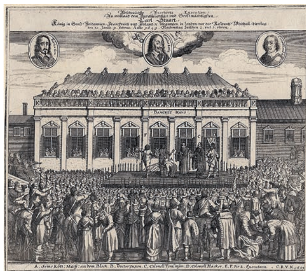
VRHUNAC RAZDOBLJA ENGLSKIH CESTOVNIH RAZBOJNIKA zabilježen je tijekom engleskog Građanskog rata (1642.-1651.) i sukoba između snaga kralja Karla I (lijevo) i parlamentaraca koji je završio kraljevim smaknućem 1649. (gore)

stavljao se izvan zakona te je odustajao od prava na imovinu i građanskih prava. Prema tadašnjoj praksi, nakon stavljanja izvan zakona, pojedinac koji se, na primjer, ne bi četiri puta pojavio pred sudom u biti bi bio obilježen poput životinje koju treba pronaći, uloviti i ubiti. Ako ga ne bi ubili kad bi se opirao hvatanju, nedvojbeno bi se suočio s krvnikom nakon što bi se utvrdili dokazi o njegovu izopćenju.