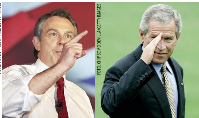
PODCJENJIVANJE JAVNOG MIŠLJENJA bilo je sudbonosno i za britanskog premijera Tonyja Blaira, a po Davidu Owenu zajedničke s Georgeom Bushom bile su mu i pretjerana samouvjerenost te nemir

U Finskoj se trubi kako bi se drugim vozačima ukazalo na njihove pogreške, a ne nužno kako bi ih se upozorilo. Vozačev pogled na svijet temelji se na pretpostavci da su drugi uvijek više u krivu. Neoprostivo je ako netko krene presporo kada se upali zeleno svjetlo. Isto je tako kod biciklista i nordijskih hodača kojima