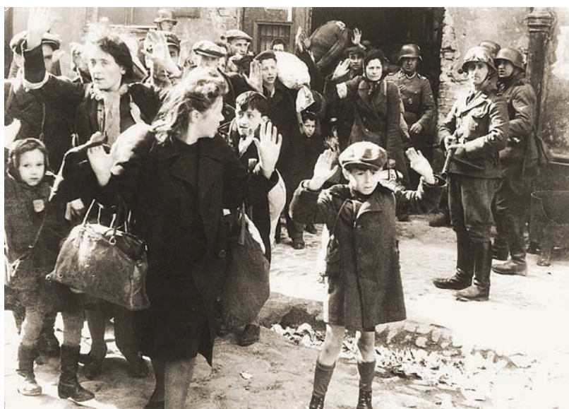
PROTJERIVANJE ŽIDOVA IZ VARŠAVSKOG GETA tijekom ustanka 1943., u vrijeme posljednjih deportacija Židova iz Varšave u koncentracijske logore

(2) Ritualno ubojstvo i kanibalizam, optužba koja je već postojala u antici da bi se ponovno pojavila sredinom XII. stoljeća