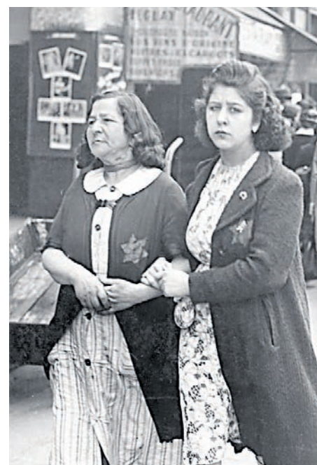
IZGOVOR ZA PROGON i pokolj Židova još od srednjeg vijeka bile su 'afere ritualnog čedomorstva' (na slici: osobne stvari ubijenih u Auschwitzu; Židovke u Parizu 1942.)