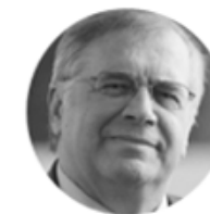
VRIJEME I VJEČNOST