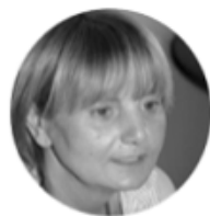
POGLED S LIJEVA