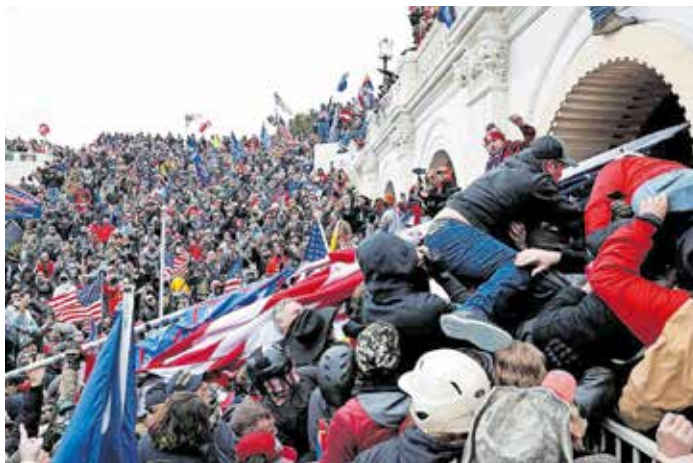
Plašeci ljude, politički lideri mogu se prikazati kao spasitelji, kao jedino što stoji između građana i ponora. Ako ljudi dopuste da se njima ovako manipulira, nestaju ograde (na slici dolje upad na Capitol Hill 2021.) oko toga što građani mogu prihvatiti i smatrati istinitim i dobrim od vode. Postaju politički iracionalni i neslobodni. Ovo je snažan trend u suvremenoj politici, s Donaldom Trumpom (gore) kao jednim od primjera koji najviše brinu, kaže naš sugovornik

Kao politički motivator nada je bolja od straha jer ona promiče slobodu, a strah je potkopava